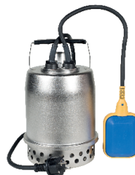
Sanisub Steel 50 A